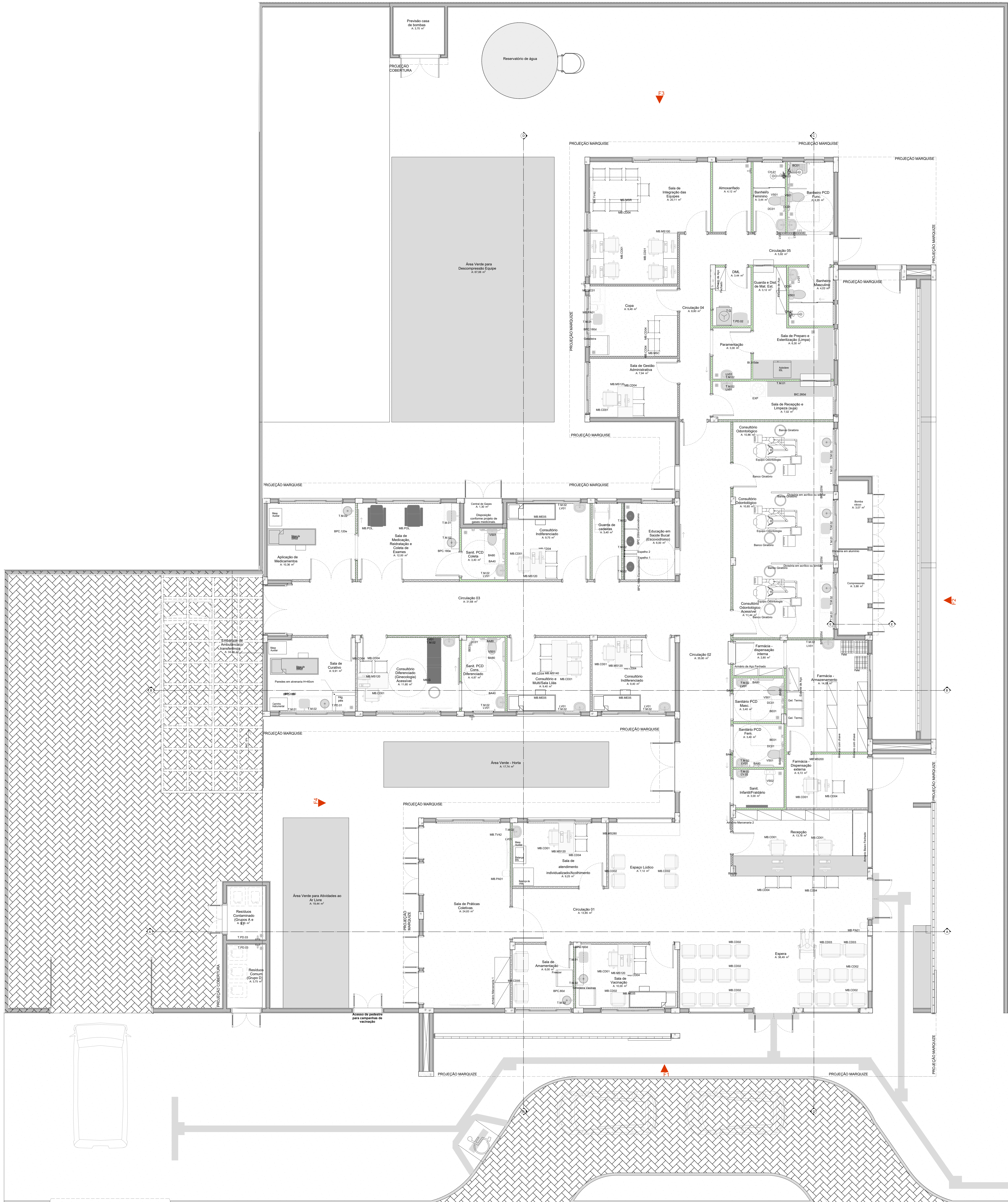
PLANTA DE LAYOUT Escala: 1:50